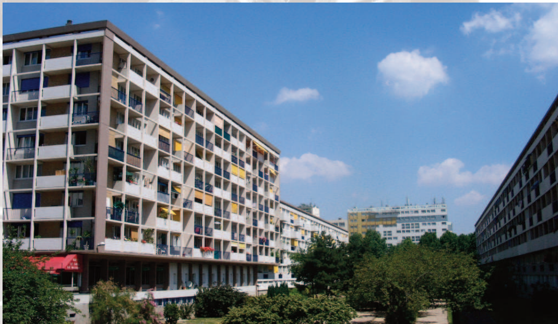
Paris - îlot Bièvre (Serge LANA, Roland DUBRULLE architectes)

Pour l'Agence , l'objectif d'être l'un des Acteurs professionnels dans l'élaboration d'une Politique Urbaine, est manifeste. Ce sera une constante de cet outil de réflexion et de production architecturale en devenir.